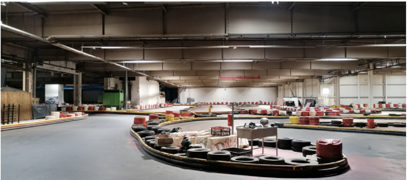
Abbildungen: Kartbahn, derzeitige Nutzung